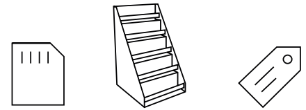
Tarjetas de teléfono